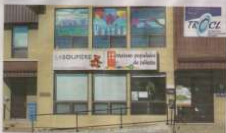
La Maison populaire de Joliette met fin à son service de soutien aux plus démunis. Le personnel est réduit à un intervenant plutôt que deux.